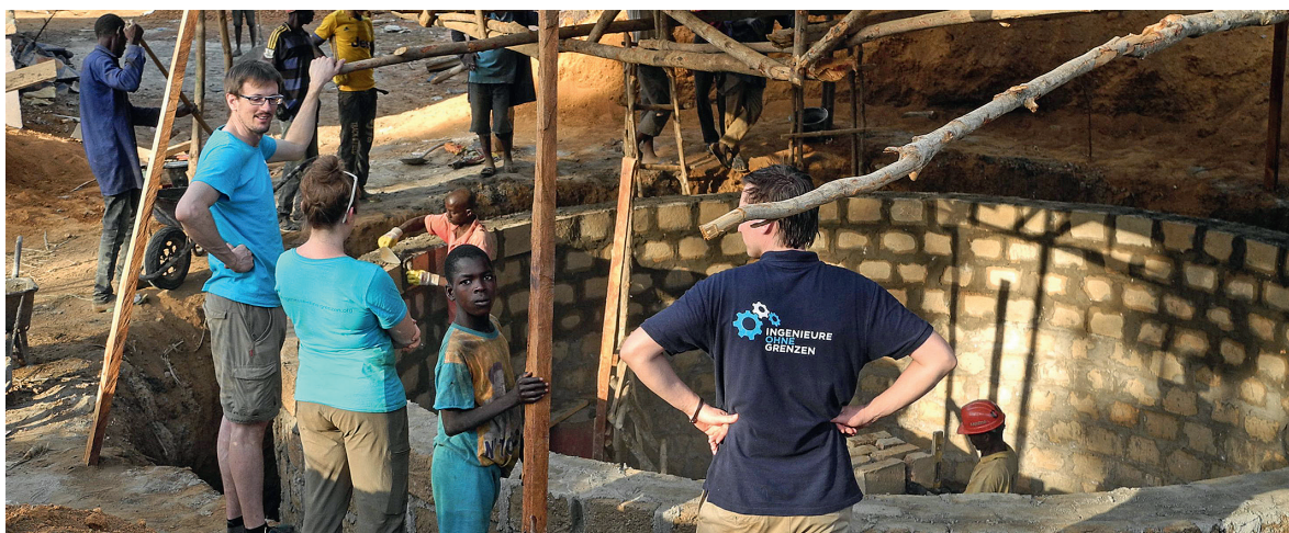
Der Bau einer Zisterne für die Dorfschule in Kanty in Guinea wurde von Ingenieure ohne Grenzen ermöglicht.

Ingenieure ohne Grenzen e.V. Regionalgruppe Bremen; Ralf Hiller c/o HBI Hiller + Begemann Ingenieure GmbH bremen@ingenieure-ohne-grenzen.org www.ingenieure-ohne-grenzen.org