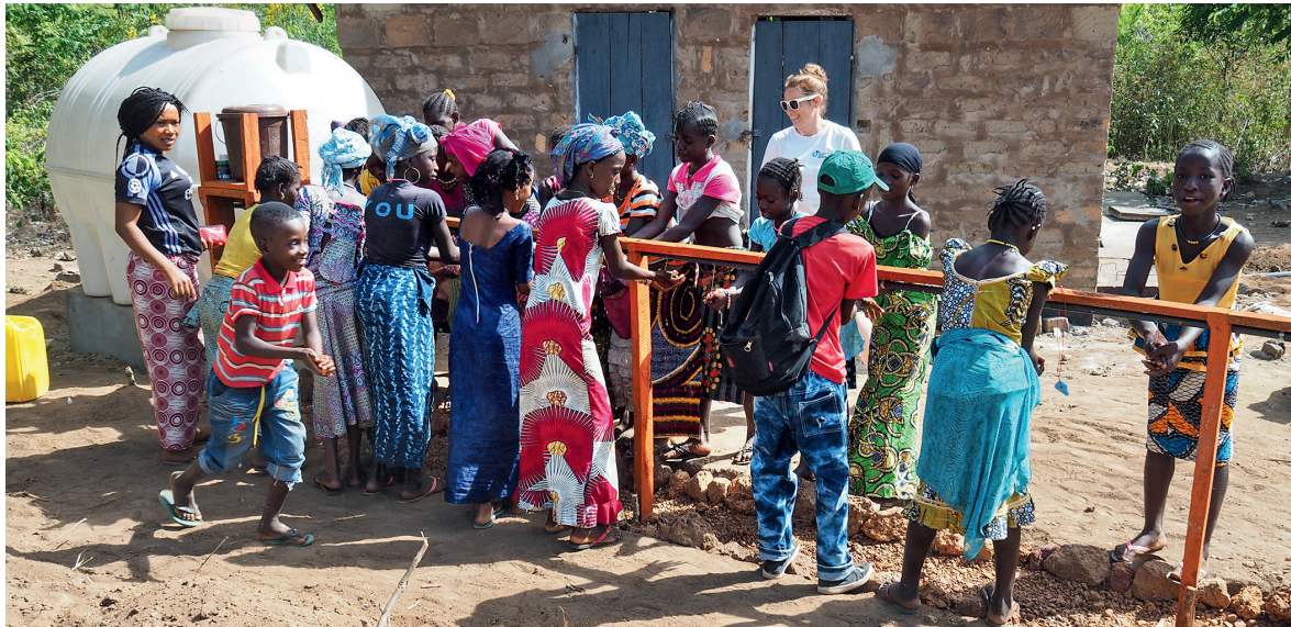
Die Wasserstation an der Dorfschule in Kanty, Guinea.

Bremer:innen – darunter vor allem Studierende und Ingenieur:innen – in Projekten rund um das Thema Wasser und Hygiene.